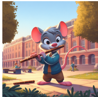
Un ratón tocando la flauta en mitad de un patio de colegio. Arte Disney