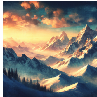
Montañas nevadas saliendo el sol por la mañana. Formato lienzo