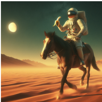
Un astronauta comiendo un plátano montando a caballo por el desierto.

Poniendo a prueba a la IA, algunos ejemplos del resultado: