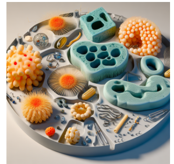
Las partes de la célula en 3D